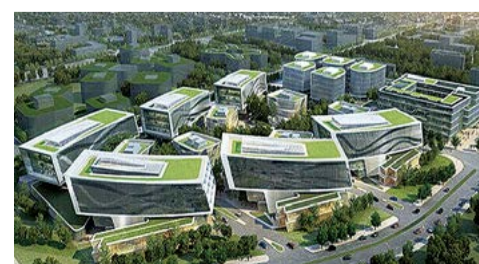
虹桥正荣商务中心