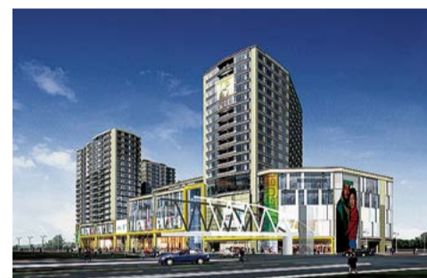
上海香港名都项目