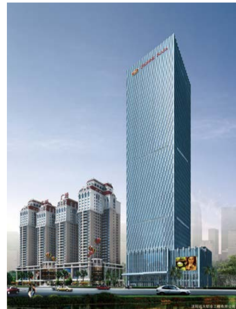
南宁南湖名都广场